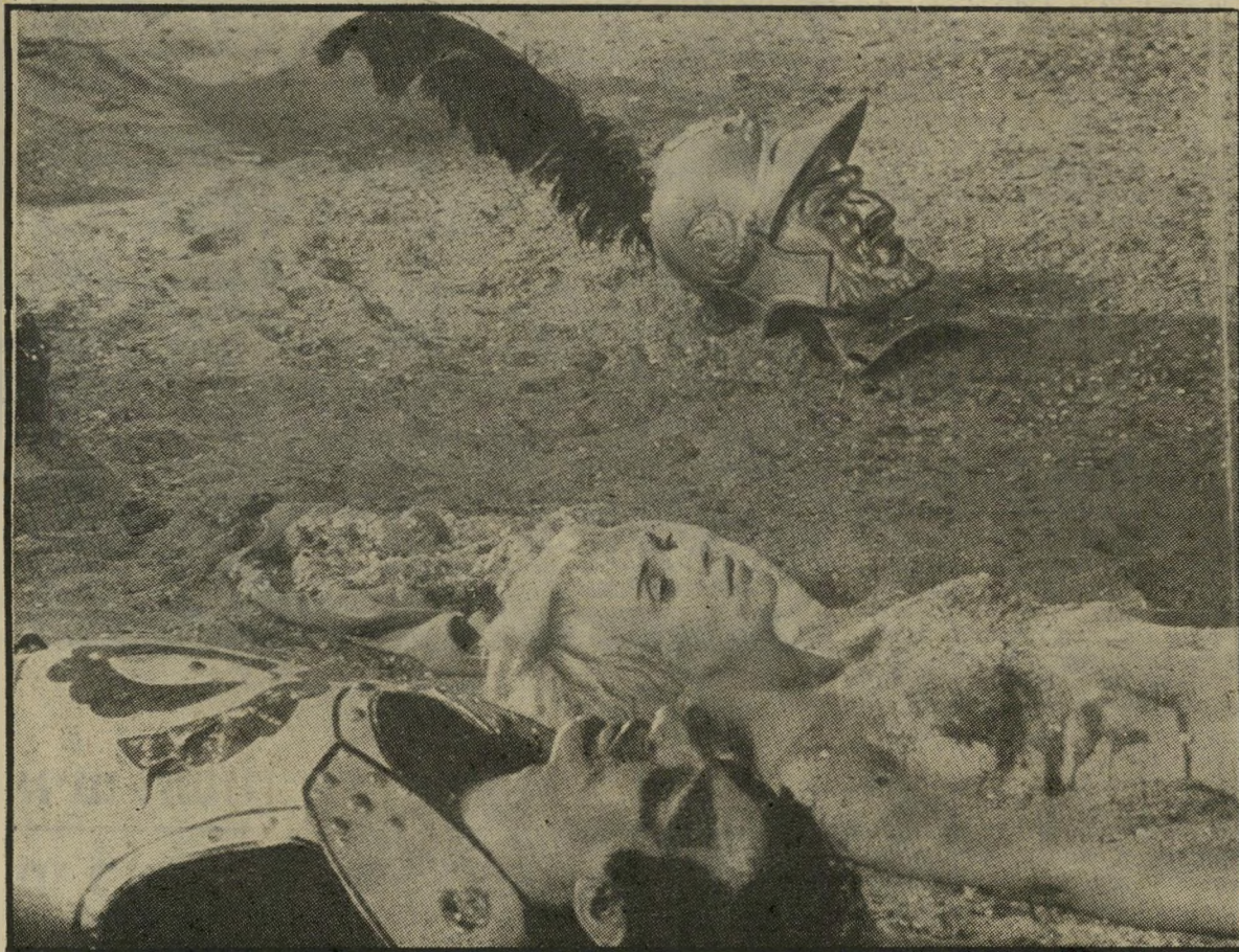
ג'ין סיברג בתפקיד אדריאנה, הנימפומנית ב"ציפורים מתות כפרו" מיפלטת רבת ראשים

ליים, שבזמנו הציגו במלכודן את לאט יותר שלו וזיכוהו בפרס. הם ביקשו לראות קטע מסרטו פרשת וינשל. מאחר והמפיק שלו, יעקוב קוצקי, לא הספיק להכין עותקים על גבי קאסטות, שלח הפנר לאוסטרלים קאסטת מתוך לאן נעלם דניאל וקס ? וראה