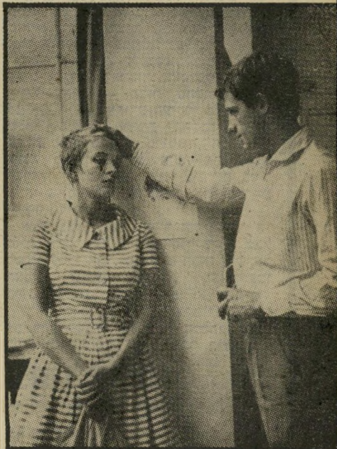
סיברג ובמלונרו על פיסגה גבוהה

הצעירה הנפחדת. אלא שהעבודה עם אוטו האיום שברה שחקנים ותיקים ומנוסים, שלא עמדו בטירור שהוא משילט על בימת־הצילומים. הצעירה הנפחדת עבר רה את הטרואמה, אך כנראה שלא הצליחה להשתחרר ממנה כל חייה. כי אחרי הסבל, המאמץ, העבודה הרבה ותלומות־הזוהר, בא מפח הנפש. הסרט היה כישלון קופתי ואמנותי, והנערה בת ה-19 מצאה עצמה על פיסגה גבוהה, בלי קרקע מתחת לרגליה. כל חייה, מאז, היו סידרה ארוכה של נסיונות להוכיח, שהיא בכל זאת ראויה למקום בפסגה. מדי פעם בפעם נראה האור בקצה האפלה, אך הוא נעלם במהרה. לאחר עד כלות הנשימה, עם ז'אן פול בלומנדו, בבימויו של ז'אן לוק גודאר, היא הפכה כימעט סמל של הגל החדש בצרפת. היא ניסתה לנצל את הסמל הזה מהר מדי, באמריקה שמצפצפת על גלים, וכשחזרה לפאריס, אחרי שניכשלה, מצאה אחרות שתפסו את מקומה.