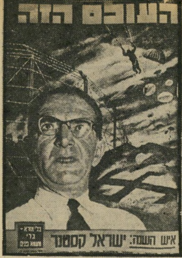
"העולם הזה" 884 תאריך: 23.9.54