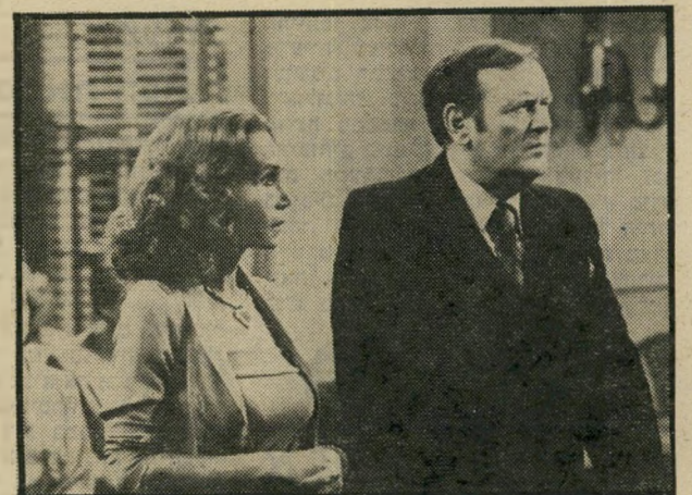
בועות : הלמונד רוש יום חמישי, שעה 11.20

● מישפט פראדיין (10.05). סרט בן 31 שנים של אמן המתח אלפרד היצ'קוק. סיפור אהבה בין אשה הנא" שמת ברצח בעלה לבין עורך-