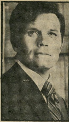
הוואי : לורד יום ששי, שעה 10.50

● קונצרט (10.10). התיזמורת הפילהרמונית של לונדון עם הכנר האיטלקי סלור טורה אקארדו מגישים את ה"קונצרטו לכינור ותיזמורת של