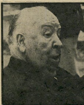
מישפט פראדיין : היצ'קוק יום שני, שעה 10.05

● מנהיגים שעיצבו את פני המאה (8.30). הפרק השני המוקדש ליוסף סטאלין, בתום מילחמת-העולם מציע סטאלין לבני עמו עולם חדש. אולם במהרה מתברר כי העולם החדש של סטאלין הוא עולם האימה, הטרור, הרציחות הפוליטיות והחקירות במרתפים השוכים.