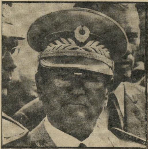
המרשל יוסף ברוז'טיטו מטע'צלב נגד הוותיקים

העסקנה מוראנת. לעומת העם היוגוסלבי, שהפגין אהדה אמיתית לטיטו, גילו העסקנים הוותיקים של המפלגה הקומוניסטית היוגוסלבית עצבנות ודאגה. מזה חודשים רבים מצהיר טיטו על כוונותיו להנהיג רפורמה מרחיקת