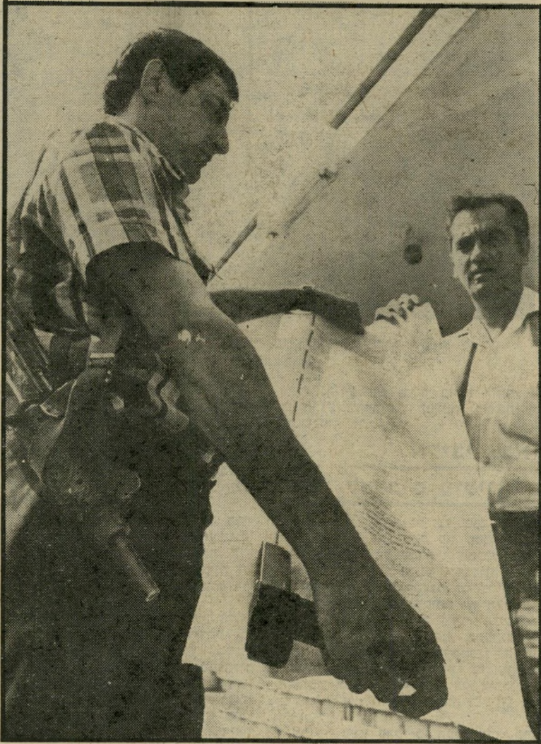
מנהיג כהנא ושומר-ראש דיין מי מסית ומדיח?

בחודשים האחרונים נוהג מאיר כהנא לחרוש את הארץ לאורכה ולרוחבה. לא תמיד הוא נוטל עימו את צבאו. לפעמים הוא מסתפק רק בחיל החלוץ — יוסי דיין. לעתים הוא לוקח גם אחרים. אך צבאו מצטמצם ומצטמק. חייליו נשפטים בזה אחר זה, בעיקבות תוקפנותם ותקיפותיהם.