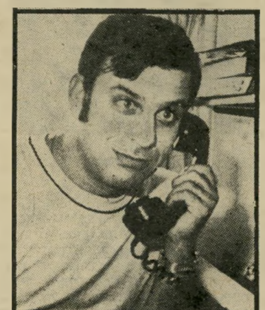
מתפטר מויאל קרנות סודיות?

מאז תחילת 1973 חשו אנשי מחלק הסמים של תל-אביב בורם קבוע של חשיש ואופיום המגיע לאיזורם. אחרי מאמצים רבים השיגו מודיע, שהיה מדווח להם כל פעם על כמויות הסמים הצפויות. ברוב המקרים צדק המודיע, ואנשי הסמים ראו כי כדי למצוא את המקורות עליהם לשר תול סוכן שלהם כקונה מדומה. הבעיה הייתה להשיג מימון לרכישת אופיום, סם יקר ביותר, כמה מישלוחים הגיעו בלי