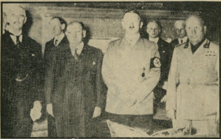
מוסוליני, היטלר, דלדיה, וצ'מברלין בחתימת הסכם מינכן 29.9.1938

28.9 — נשיא מצרים, גמאל עבד אל-נאצר, נפטר מהתקף לב. סגנו אנוואר אל-סאדאת מונה כממלא מקומו.