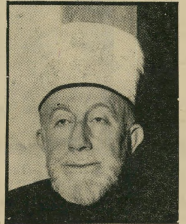
המופתי אל-חוסייני כמו עראפאת

אם כי אין התנגדות מצד ישראל ל"מאמץ" המכוון להביא לידי סידור היחסים היהודיים-ערבים בהסכמה הדדית, פוליטיקה שישראל הביטה עליה תמיד