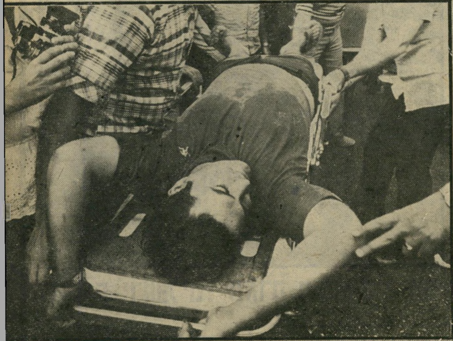
בלי הנרה הפצוע ששכב קודם לכן על הכביש (בתמונה מימין למעלה) הושכב על אלונקה כשהוא מחוסר הכרה ומובל לאמבולנס. את אשר לא הצליחו המפגינים הדתיים לעשות למפגינים החילוניים עשה פרש מיטרת.