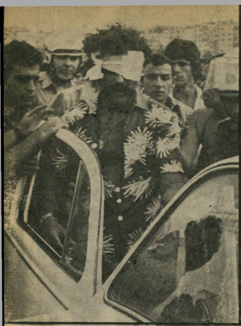
בעין מפגין חילוני נפגע בעינו מידי אבן שהוטלה מהעבר הדתי. תחילה חשבו כי איבד עין ובמקום פרצה בהלה, אך אחריכך התברר כי עינו בסדר.

בצד הדרך, כמו מכוניות אחרות שעליהן יכלו השוטרים להצביע כמכוניות-מחאה, עד צאת השבת.