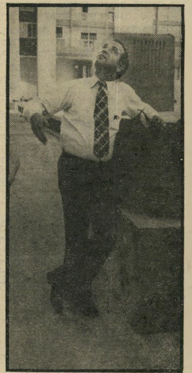
השר פת בקבוק מתפוצץ

אייזנברג היה רגיל בעבר כי בכל עסי-קיו יתנו לו את מבוקשו, תמורת טובות