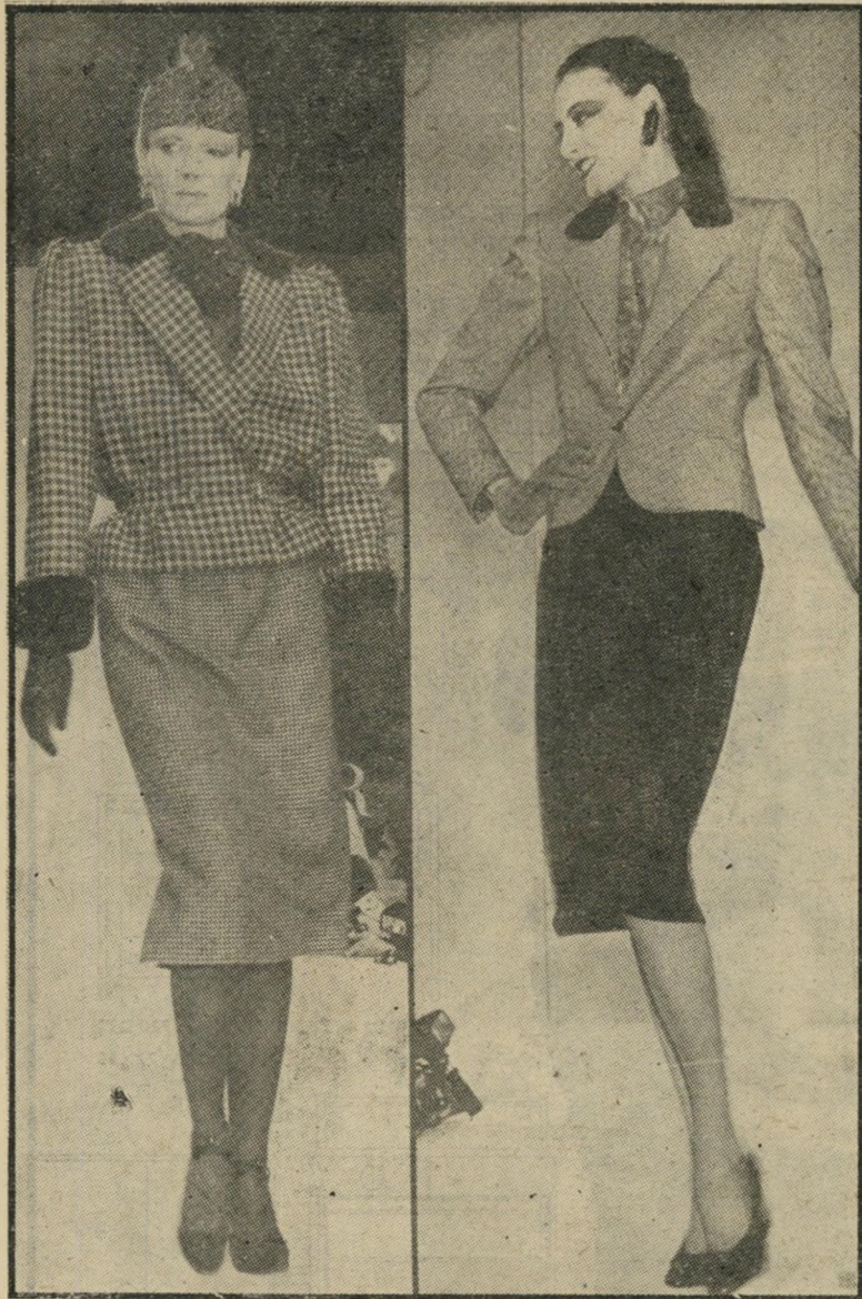
מישחקי כדים שונים על הז'קטים והחצאית הפאריסאים קרוטי וולנטינו