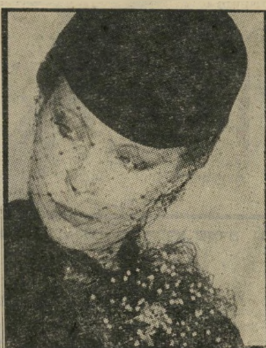
הרשת הוסרה מעל העיניים ועתה היא מכסה את האוזניים או את הסנטר להשתמש ברשת כיד הדימיון הטובה עליך