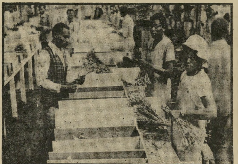
אורזים פרחים בקניה לייצוא הכל לגרמניה

ב-1978 ייצאה ישראל ב-40 מיליון דולר לערך, וקניה הגיעה לייצוא של 9 מיליון דולר, לעומת כמה מאות אלפים לפני חמש שנים. הקונה העיקרי היא גרמניה-המערבית, הקונה שני שלישים מכל ייצוא-הפרחים מקניה. הייצוא מקניה מהווה 20% מייבוא הפרחים של גרמניה, ומתחרה קשות בישראל. יותר מ-3500 איש עובדים במרכזי גידול-הפרחים, המרחיבים עתה את השטחים ב-1000 דונם נוספים, אשר יוסיפו 120 מיליון פרחים. הפרחים גדלים ללא כיסוי, בגלל תנאי החום והשמש היציבים במקום.