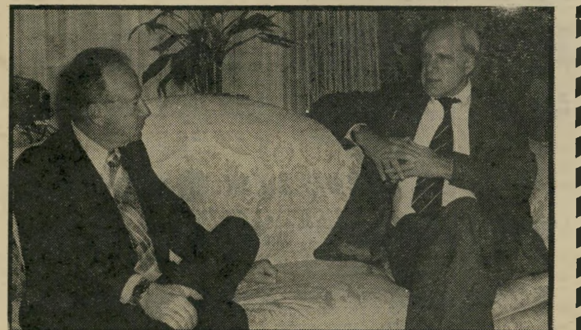
השר גיימס שלוינג'ר בשיחה עם יצחק רבין

פ ני שני דורות כתב היסטוריון גרמני בשם אוסוואלד שפנגלר יצירת-ענק קודרת, שהיתה לה השפעה עצומה על מחשבת המאה ה-20. שמה העיד על תוכנה: שקיעת המערב. שפנגלר חילק את ההיסטוריה העולמית ל-"תרבויות". כל תרבות היא, לפי הגדרתו, היחידה רעיונית-מדינית-חברתית. גורלה של תרבות הוא כגורל האדם: היא נולדה,