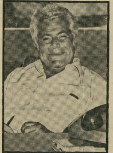
יוזם מיזמון כל אחד מומחה