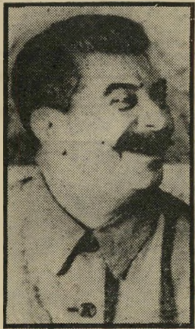
מנהיגים: סטאלין יום שלישי, שעה 8.30