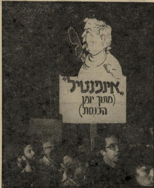
אנשי "שלום עכשיו" מפגינים נגד שרון

בסוף תשל"ט היה גם עתידו של וייצמן לוטה ערפל סמיך. היו שקיוו כי ישתלט בבוא היום על הליכוד, ושישליט בו את היסודות הליברליים שוחריהשלום. היו שקיוו, לעומת זאת, שהוא יידחק אל מחוץ לליכוד, וכי ייטול לידיו את היוזמה להקמת מחנה שלישי גדול, אשר יהיה בכוחו לשנות את מערכת הכוחות הפוליטיים בישראל.