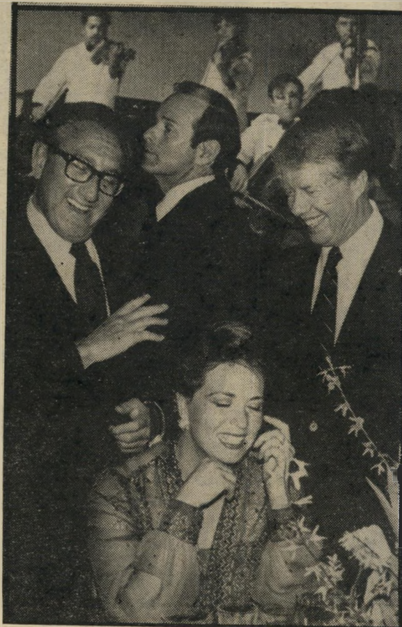
בוואשינגטון: קארטר, ג'יהאן וק'סינג'ר

גם אנוור אל-סאדאת לא היה איש-השנה של תשל"ט. גם מבין השלישיה המובילה בישראל לא יכול היה איש לזכות בתואר. איש-השנה תשל"ט, מנחם בגין, נראה בראשית השנה