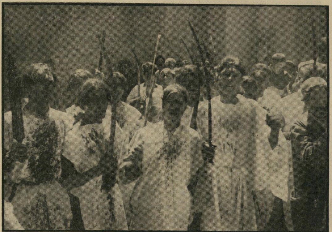
חסידי האיית-אללה, סבגדים וגואלים כדם, בהפגנות נגד השאה שארכו 13 חודש

השאה התנדנד על כסאו. באיחור רב תפסו האמריקאים כי לרודן משוגע-הגדלות יש כרעיית-רגולת. במאוחר, כרגיל, החליטו לסלקו, כדי להציל את המישטר הפרו-מערבי. השאה הוברח, תחילה למארוקו ולמצריים, ולאחר