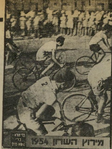
"העולם הזה" 883 תאריך: 22.9.54