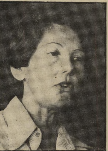
שופטת בן-עיתו האם הביטוח בטוח?

כאשר קבע המהוקק שלילה לתקופה כה ארוכה, התכוון להגן על נפגעי תארי נות הדרכים. בזמנו, מי שלא היה מבוטח ופגע באדם, גרם לו עוול כפול. גם פצעו וגם מגע ממנו את אפשרות התביעה נגד