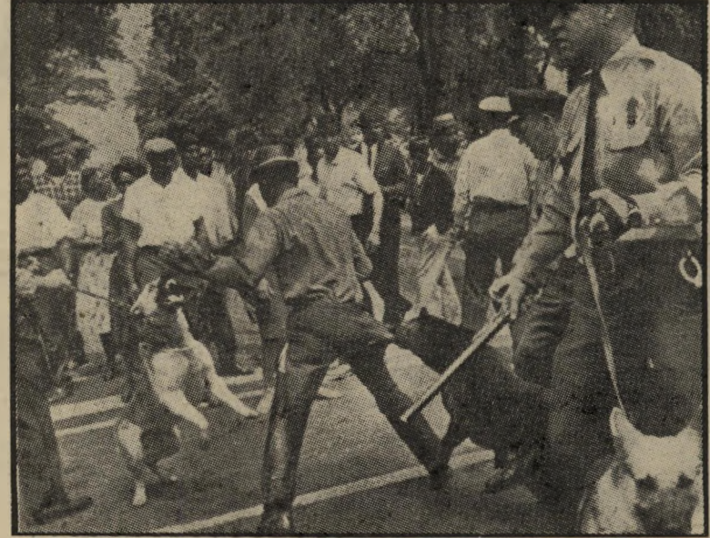
שוטרים מצויידים ככלבים ובאיזת חשמליות ומפגנים בויטלירוק 22.9.1957