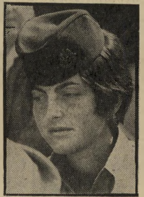
נוסעת ירין בושות ואבא

סגן שרי-האוצר, יחזקאל פלומין: "צריך להנפיק לירה עם זוטא, זו הרי"