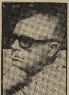
עיתונאי רוזנפדד מתשלחה וגעגועים