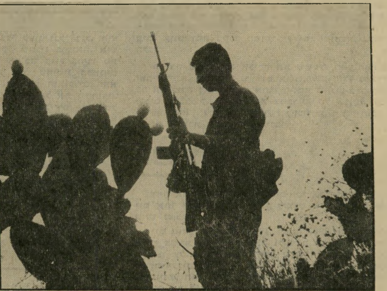
מישור הגבול מראה אופייני בכפר הערבי נעלין: חייל מישמר הגבול דרוך לכל גילוי עוינות, משוטט בין שיחי הצבר ה" מקיפים את הכפר. החיילים הרגישו הקלה, כשהצטרפו אליהם שומרים של צוות ההסרטה.