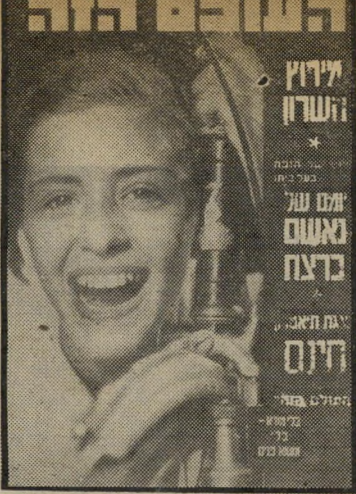
"העולם הזה" 882 תאריך: 15.9.54