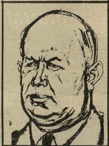
ניקיטה חרושצ'וב 13.9.1953

12.9 — מי שהיה רודן איטליה, בניטו מוסוליני, נחטף על-ידי צנחנים גרמנים ממלון בחוף אגם ברצ'יאנו, שם הוחזק במעצר. אחרי החטיפה הוא הקים ממשלה חדשה ומינה עצמו כנשיא.