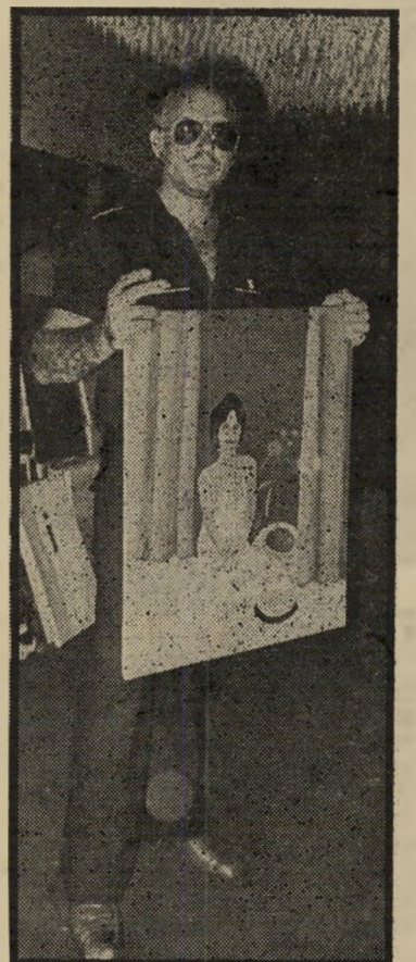
נדלר ונערה, המטרה שלי בציור זה הכסף

לפני שהתחיל לתרגם, הוא היה מופקד על ניקיון הדשא. את הג'וב הזה נתנו לו כדי לבזות אותו. האסירים, שרצו להתנקם בידלין, היו ממתנינים עד שהיה מסיים