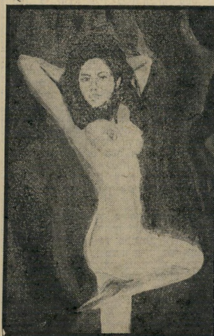
עירום בכלא מהווה יותר מאשר יופי לשמו. זהו מיצרך מבור קש, הבא לכסות על המחסור המציץ בנשים.