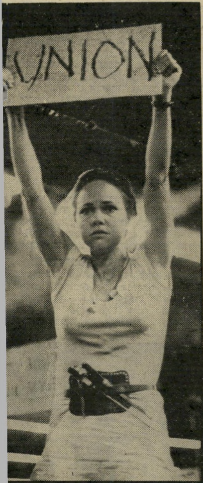
שחקנית סאדי פירד לוחמת חברתית

"היה קשה. לא נתנו לי לדבר במשך שש-שבע שנים. אבל, לא כלאו אותי ב" בית-הסוהר. פשוט לא נתנו לי לעבוד בסרטים. אבל נישארתי בחיים. לא עשיתי סרטים אבל לימדתי קולנוע. שנים רבות אחרי שחזרתי לקולנוע עשיתי את שם בהשאלה. מעולם לא חשבתי שאצליח לעשות את הסרט הזה. והנה, בכל זאת עשיתי אותו. וכשאמרתי שאני עומד לעשותו איש לא מנע זאת ממני. ויותר מזה: סרט זה זכה בפרס הסרט-הטוב ביותר — באיראן! ואני סירבתי לבוא לשם ולקבל את הפרס. אמרתי בגלוי, שלא אלך לשם. כי במדינה זו שורר מישטר של דיכוי. זה נשמע מטורף לחי לוטן. מדוע הם בחרו בי? הם שלחו לי