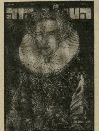
איש השנה תשל"ב גולדה המלכה