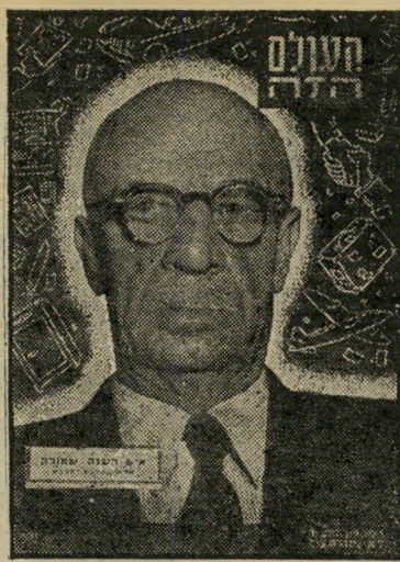
איש השנה תש"ב מבקר הסוכנות שמוראק