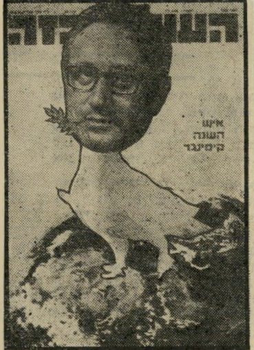
איש השנה תשל"ד מסדיר-ביניים קיסינג'ר