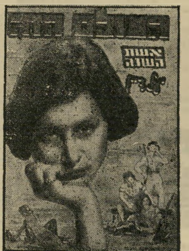
איש השנה תש"ט סופרת דיין