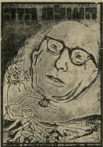
איש השנה תשכ"ז כלכלן ספיר