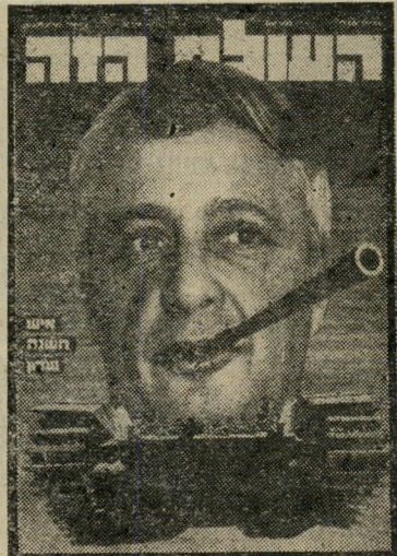
איש השנה תשל"ג מקיס-הליכוד שרון