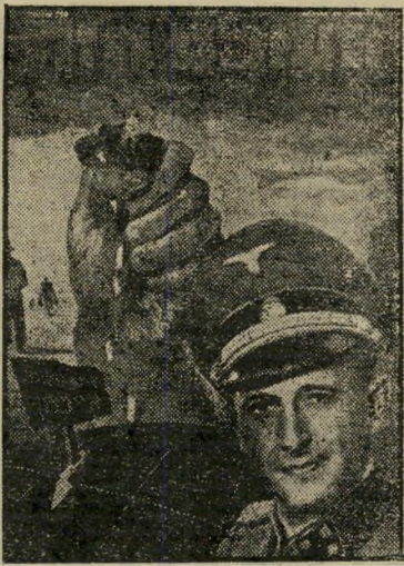
איש השנה תש"ד רכז-שואה אייכמן