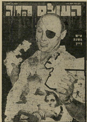
איש השנה תשכ"ז שרי-הביטחון דיין