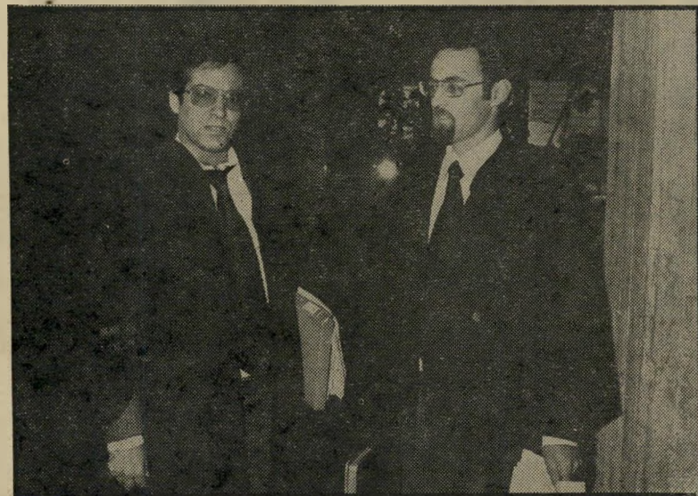
עורכי-דין שיש וישראל טעות לעולם חוזרת

הקורא פינקו צודק. עורכי-דין ישי-ראל - ראה תמונה.