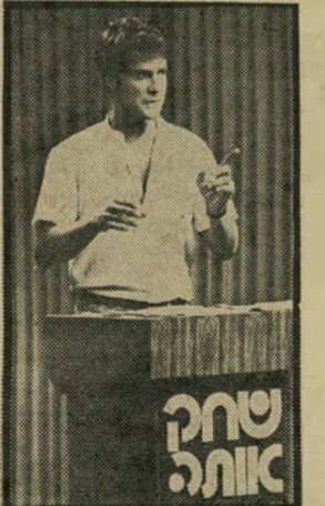
שחק אותה: טופו יום שלישי, שעה 8.00