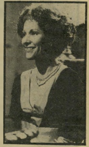
אדונים ומשרתיים: בלאמי יום רביעי, 8.00

תים (8.00) היזול בלאמי, אשתו החדשה של גיימס (ראה ג'ופה), מקבלת שיחת טלפון מרוזנת צרפתית בשם לילי, הטוענת כי הכירה את ריצ'ארד לפני כמה שנים, ורצוה לבקר בבית בעת שהוריה תה בלונדון. היזול מניחה את לילי ואחיה קורט לארוחה. אז מתגלה כי לילי היא הרפתקנית, יפהפיה אך חסרת-מנוח, המנסה למצוא לה בעל עשיר שיפרנס אותה ואת אחיה. היזול חושב שריצ'ארד בלאמי הוא האדם המתאים לכך.