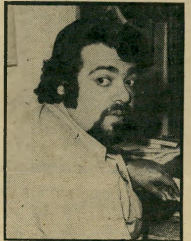
מפיק גינת עוני חמור