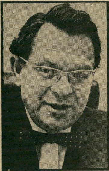
ממרא מקום אבנר רעיון לעתיד

תובכים חבוקים במסדרונות הטלוויזיה כרעים מזה שנים רבות.