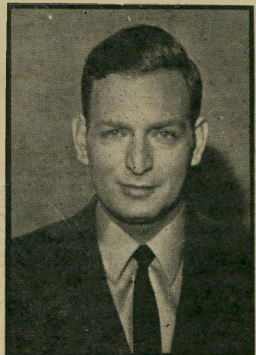
קריין אורגד פטיציה נגד מסיבה

אולם למרות זאת, השתפרו שירותי הדוברות דווקא כאשר אבנר הפך ממלא-המקום. אבנר, כאיש מקצוע וותיק, מבין כי אין זה מתפקיד הדובר לרומם ולשבח