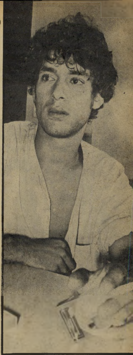
ג'מיל "אני גמור!"