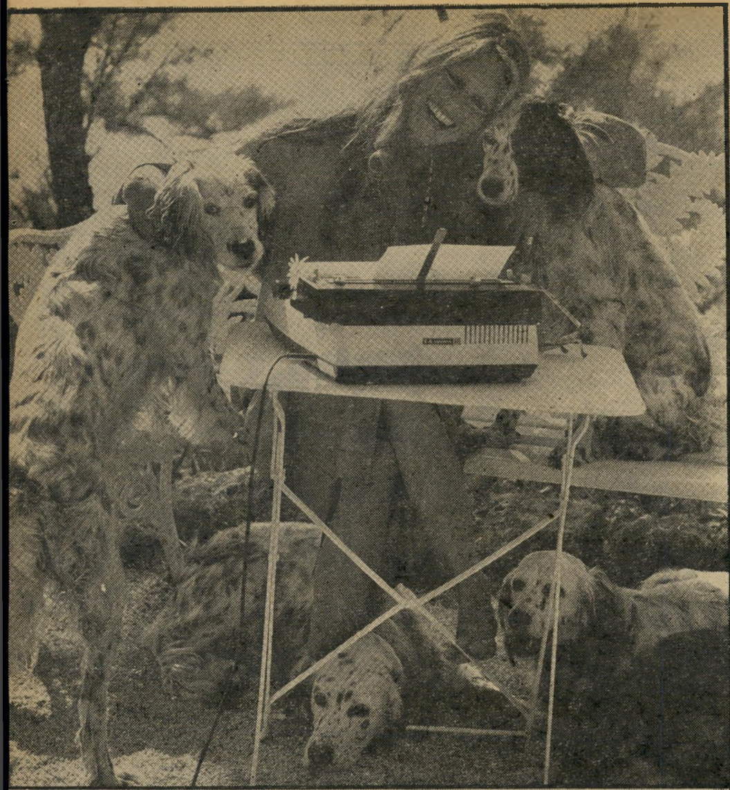
סופרת בריגיט בארדו כותבת את זיכרונותיה בהשראת כלביה