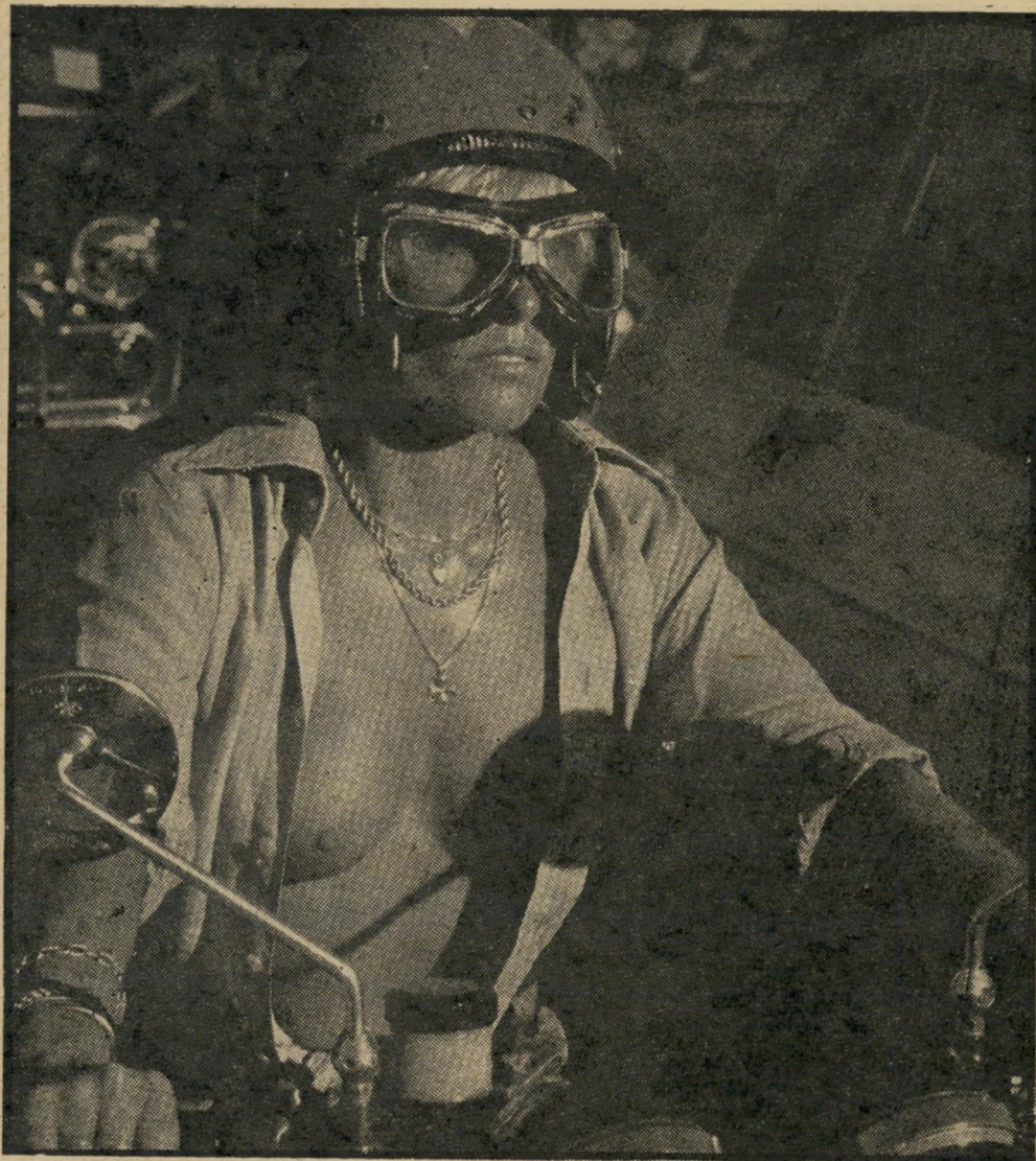
אופנוענית יורדת לריביירה בחולצה פתוחה