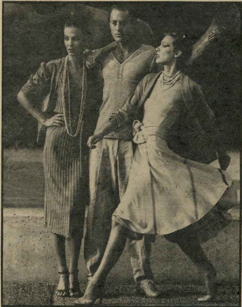
שנות החמישים „סטרפס" ופריג „נירקס" לקיץ שנות ה-80

שפיר, עשויה מבדים כגון סופלינה, כותי-נה כבדה וקלה ופיקה. הקולקציה מורכבת משני קווים עיקריים: קו ישר וצר המבליט את גיזרת הגוף, וקו צמוד באי-זור החזה כשהחלק התחתון רחב ועשיר בבד. הכיפתור משמש חלק אופנתי בבגד. דגמים רבים מתכפתרים מהצד, מאחור או בקווים אלכסוניים. הצווארונים בהירים,