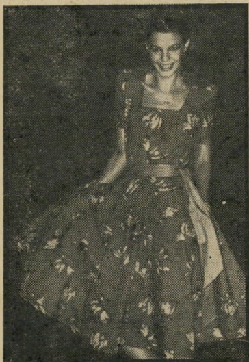
כתפיים מודגשות אצל „כיתן"