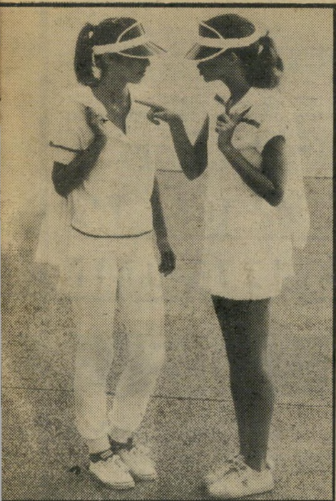
כותנה-אקרילן ספורטיבי „נירקס" לבן עם פסים בצבעים נועזים

הדוגמה האחרונה היא המראה האחורי, או „הפתיעי את רואיך במראה הגב". מחי-