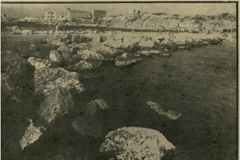
חוף "שרתון" בתל-אביב כמו שלולית עומדת

הפרשה זכתה לפירוט מירבי, עורך את ראש עיריית ירושלים, טדי קולק, להגין את נאמנותו למיסעדה החביבה עלי יין ליהודים. אלא שהמחווה של קולק לא הרגיעה את פאר, הוא זכר את הימים הטובים, כשאירח את נשיא ארצות-הברית לשעבר, ג'ראלד פורד, את סגן הנשיא ולטר מונדייל ועוד כמה אישים חשובים פאר חשש כי ימים אלה יחלפו לנשכח, אם תתמיד הרבנות בהחמיה. לנמיהר אל משרדי המועצה הדתית, כן לקבל הסבר. כשאמר לו כי הוא קונה בש