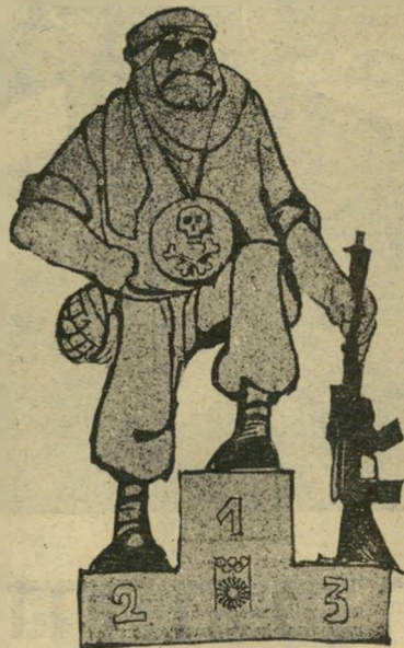
טבח מינכן 4.9.1972

4.9 — טבח 11 הספורטאים באולימפיאדת מינכן.