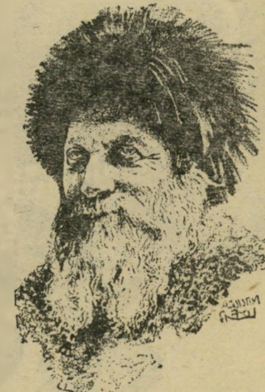
הרב קוק 1.9.1935

4.9 — יונת-דואר של ניל"י נתפסה בקיסריה והדבר הביא לגילוי המחתרת על-ידי התורכים.