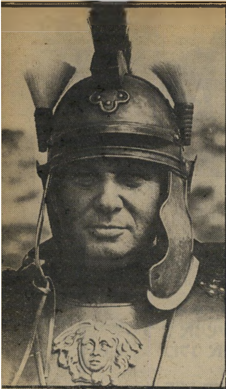
צנטוריון ניצב ישראלי עשוי להתגלות ככוכב בתל"ב בשנת צנטוריון רומי ששוחזרה באולפן.