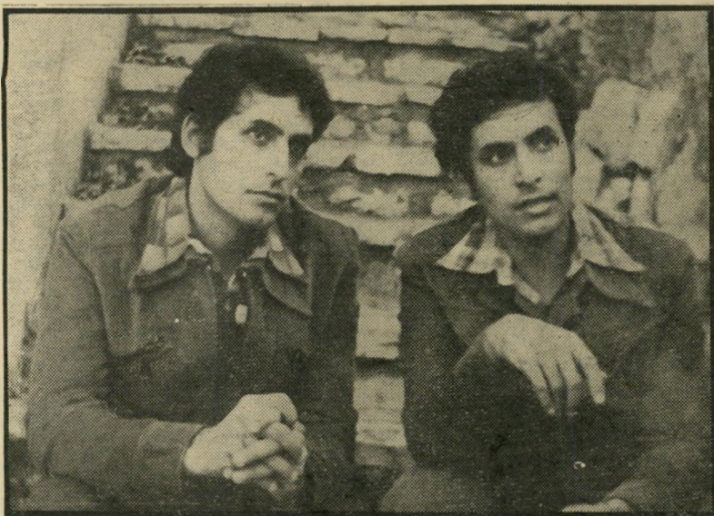
תאומים הרצץ ובלפור חקק "מקור נקש חרק"

הרי הצבעתם בעד השלום הזה / ובלעדכם לא היה הוא לחוזה. / אבל פרס מחייה, ביום החמישי, ה-9 באוגוסט, שמעתי