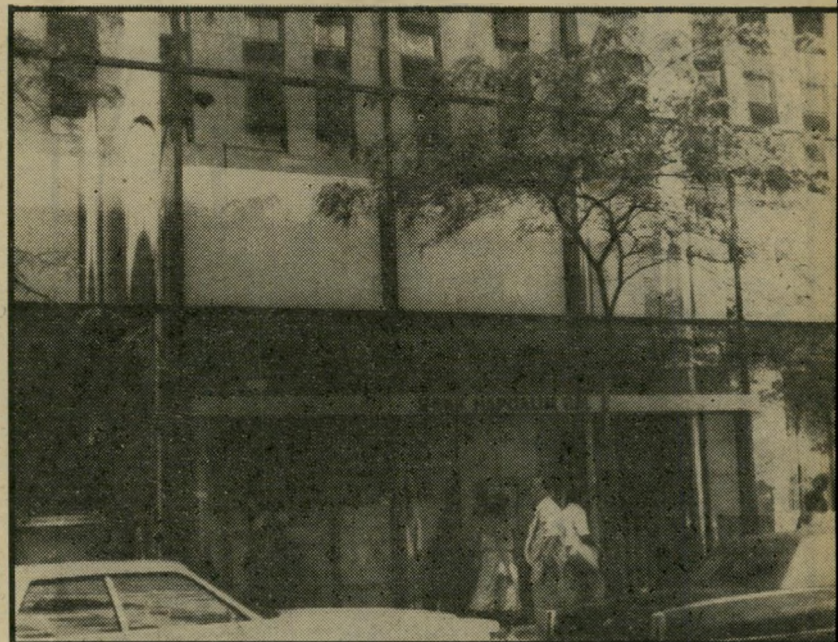
סניף "בנק הפועלים" בניו-יורק משהו באמצע

מדינה אחת. יצטרפו להודיע באיזו מדינה יפעלו, ורק בה יותר להם לפתוח סניפים נוספים. יתר הסניפים שהקימו יישארו ללא שינוי.