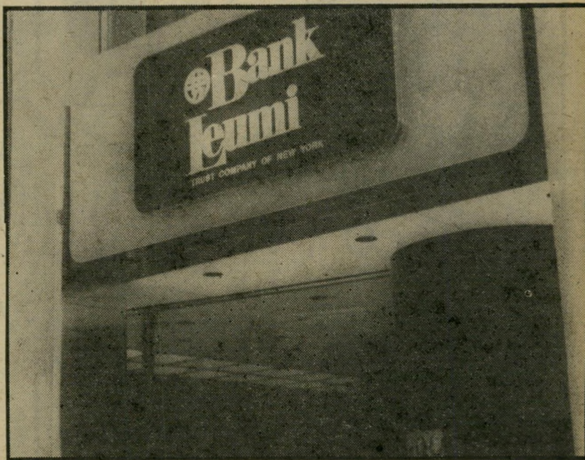
סניף "בנק לאומי" בניו-יורק סניפים בכל מקום