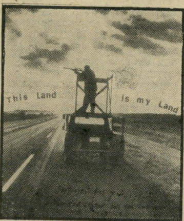
תמונה שד תומרקין למען הדיוק

למען הסדר הטוב ולמען הדיוק ברצוני לציין, שאת החוברת-זוטא אמנם יזמתי אני, אך השתתפו בה ארבעה אמנים: אבי