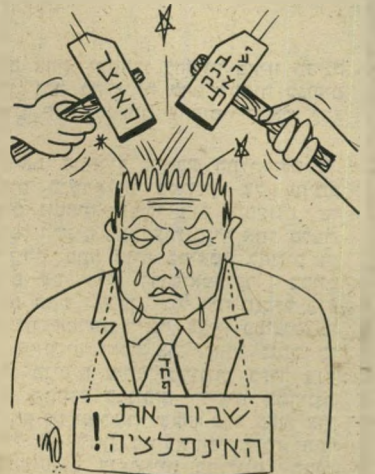
את מי שכרו כאמת? את הכיס הציבורי

כל הכבוד לאסתר אלכסנדר. כאשר תקפו פוליטיקאים את דחף ואת שר האוצר על מסע הביזבוז הראוותני שלהם בעניין שבי