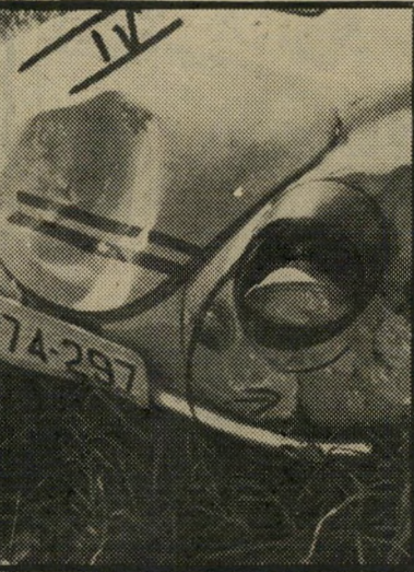
הפגיעה בחזית ה"סובארן" הגלגל נכנס לבור

א נותר לבית-המישפט אלא להחריט ליט אם בנהיגתו זו ידע לביא שהוא מסכן במודע חיינם של אנשים, ואם נטל על עצמו סיכון זה. בכך נחלקו דיעותיהם של השופטים. השופט בר טען כי אילו שוכנע שהנא-