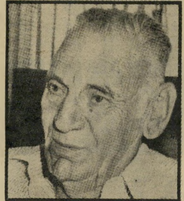
פורש סריג 37 שנות-ביטחון

ניבחר לתפקיד מאחר "שתיקן את מאזני המחשבה העולמית והפך את השלום לביסס החיים".