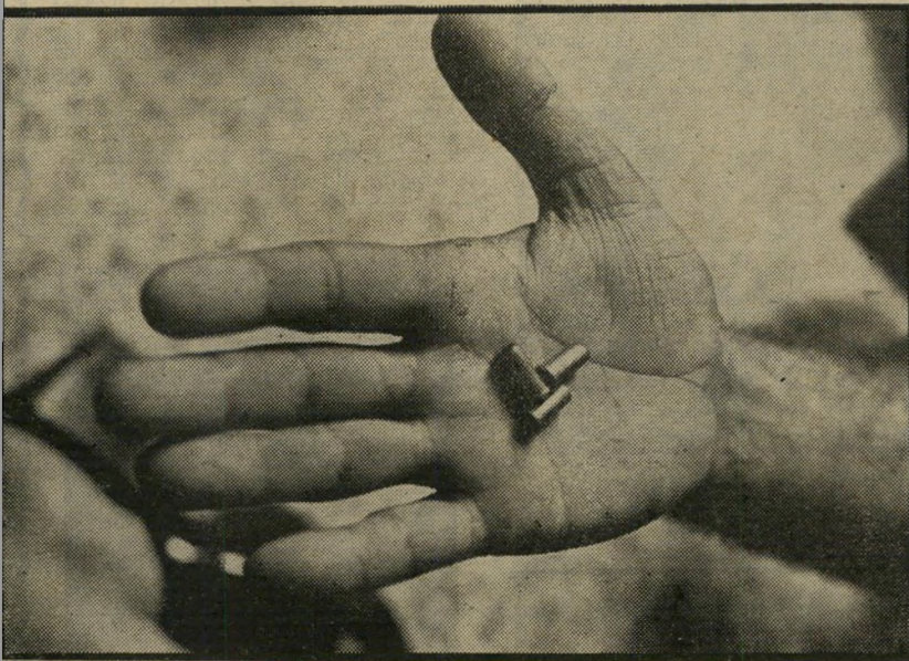
תרמיני הכדורים של ה"ברטה" אילו תרמינים נבדקו?