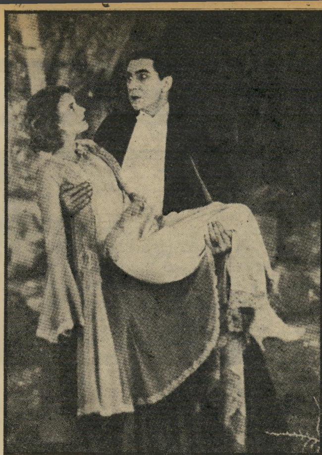
בלה לוגוזי ב, "דרקולה" — 1931: לגורל מר ממות