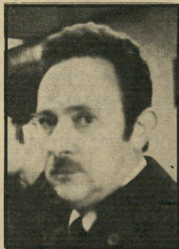
מנהל אבניאון לא מעורב

מייד עם קבלת כתב-המינוי למועצת הביטוח הודעתי למפקח על הביטוח כי אני רואה אפשרות לקבל את המינוי. הסנה, לבקשת בעלי המניות של ישראל והמפקח על הביטוח, קיבלה על עצמה, ביום 17.6.1979 את ניהול ישראל. בעיקבות בדיקה שנערכה בחברת ישראל, הוגש, אר-