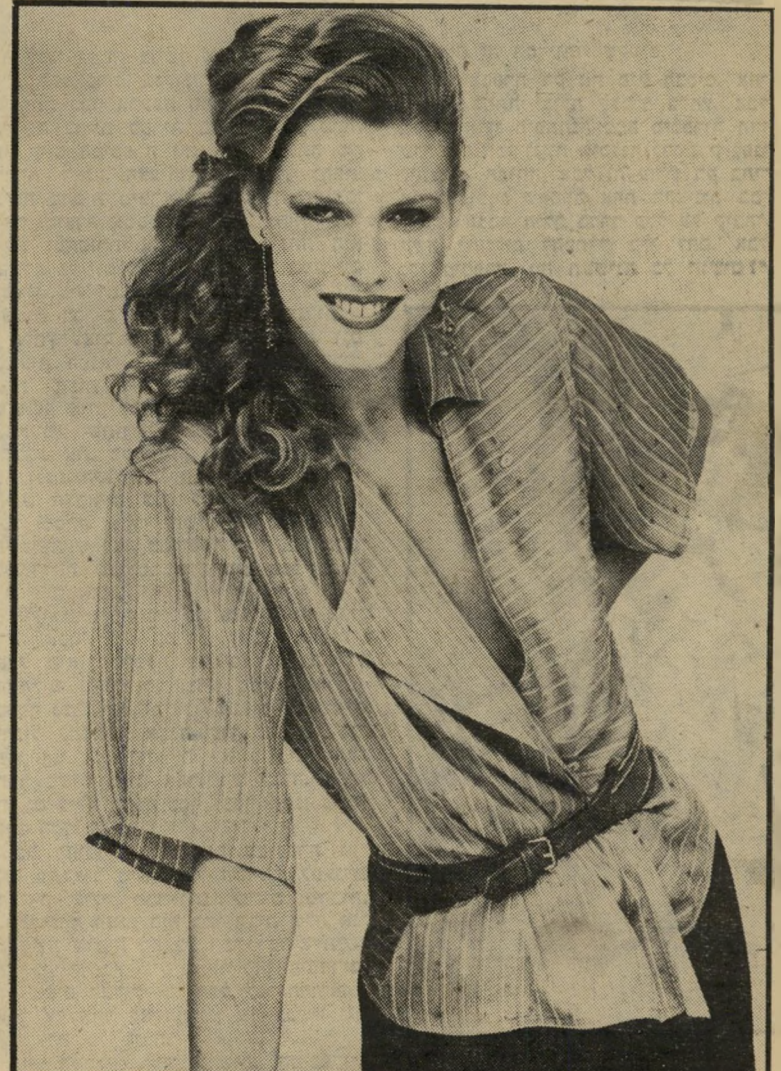
חולצת-מעטפה המוגזה טפח לכל מצב-רוח

מה אפשר לעשות משרשרת של חרוזים כאלה המקיפים את הצוואר, יורדים כלפי מטה ומסתיימים בעלה הננעץ בקצה הרי מחשוף.