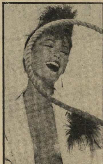
נוצות הטווס ברש ובראש לכל אירוע