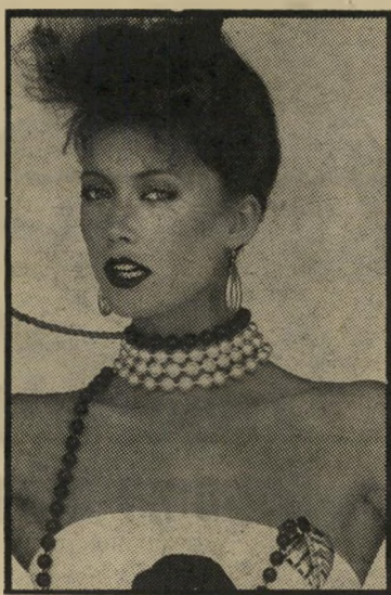
חרוזי-פנינים בכל הצבעים לא רק טביב הצוואר

זה פשוט מה שקורה היום. תמיד צצים רעיונות חדשים לגיוון באופנה. האביזרים השונים הניצמדים לבגד או לגוף הם היום הצעקה האחרונה. הנה, למשל, אם יש לך באיוו מגירה ישנה חרוזים שרי ילדים נהגו לשחק בהם ושאת היית צריכה לאסוף אותם מכל פינות הבית. הנה עכשיו תהיה לך נחת מן העובדה שמי עולם לא השלכת את כל החרוזים לפח. הביטי על הדוגמנית שבתמונה וראי