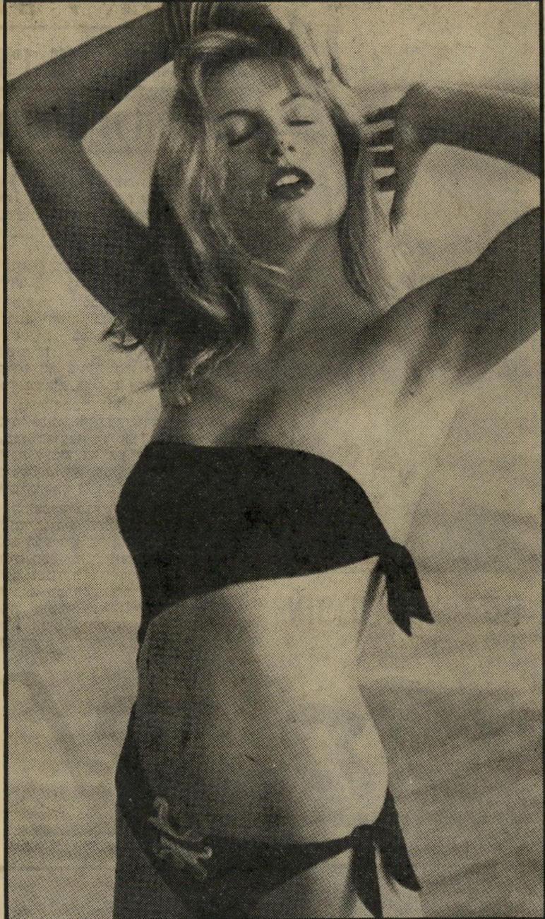
קישוטי פלאסטיק כבגדיים בסגנון המיטפתח הקשורה

אני מסכימה איתך שכבר רואים את קצה הקיץ. ולדבר היום על בגדיים אין בזה משום חידוש. אבל בכל זאת צדו את עיני שני מוהיקנים אחרונים — בגדיים שבכל זאת יש בהם משהו. חלקו העליון יון של הביקיני השחור דומה יותר למיטת פחת אלכסונית הנקשרת בקצותיה, ואם את מהנועות שלא עושות חשבון מה