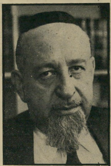
ח"כ"י דשעבר רוזנברג זוכה

מישטרה היפושים בכיתם ומוצאת שם סמים, רכוש גנוב, כל-ינשק ומטבע זר. בבית-המישפט העליון נחלקו הדיעות. השופט יצחק כהן קיבל את טענתו של הסניגור במלואה. תוך הסתמכות על מיש"פכנים אנגליים אמר השופט כי אומנם רשאי בית-המישפט לקבוע לפי עובדות המיקרה, שאדם מחזיק כל מה שנמצא בביתו, אולם לכאורה מייחסים ממצאים כאלה לבעל ולא לאשה וחובה להוכיח את המחשבה הפלילית. לכן קבע השופט כי לא היו ראיות מספיקות במיקרה זה להוכיח כי הבנקוטים היו בחזקתה של רבקה. כדי לחזק את דבריו ציטט השופט סעיף 144 (ב) לחוק העונשין, סעיף זה אומר: "מקום בו נמצא נשק, רואים את מחזיק המקום כמחזיק הנשק. כל עוד לא הוכח היפוכו של דבר." מכיוון שהסעיף המדבר על חזקה סתם ואינו מטיל את הוכחת היפוכו של דבר על הנאשם, למד השופט שהוכחה זו היא על התביעה.