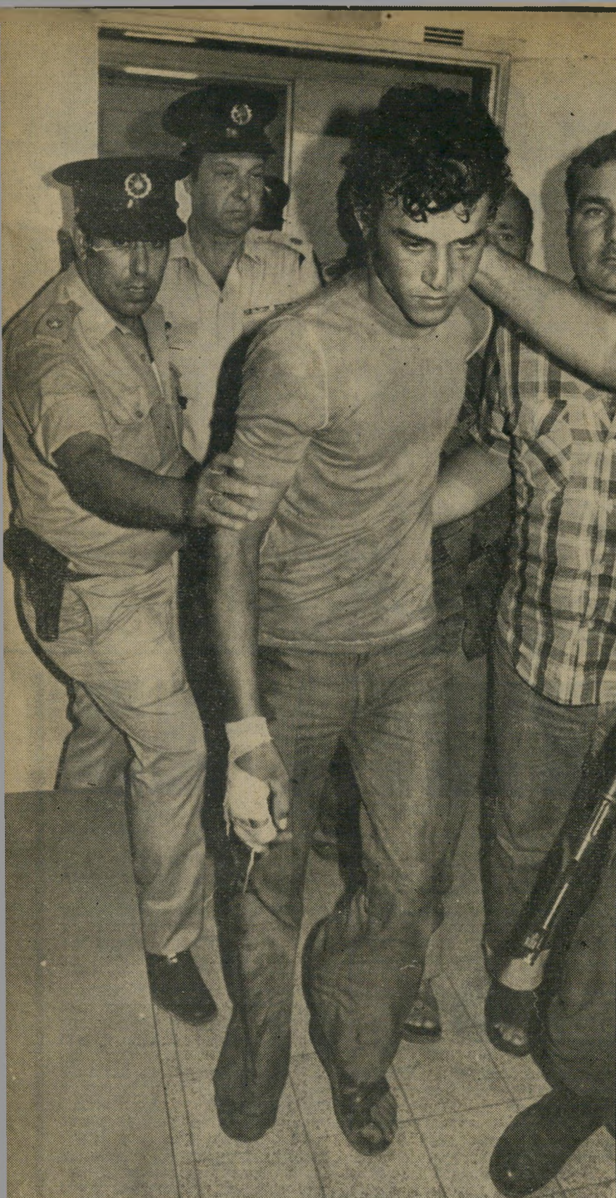
חשוד-ברצח מנצור „האח שלי רוצח”

שם. אנחנו רוצים שיתנו לנו להרוג את הרוצחים של בעלי בעצמנו. אני בעצמי רוצה להוריד להם כל חלק מהגוף לחוד. קודם אתלוש להם את הידיים, אחר-כך את האזניים ואת העיניים, לאט-לאט אהרוג אותם, ושלא יקברו אותם. לבעלי אמנם יש מצבה, אבל לרוצחים שלו אני לא רוצה שיהיה כלום, שיתנו אותם מאכל לכלבים.