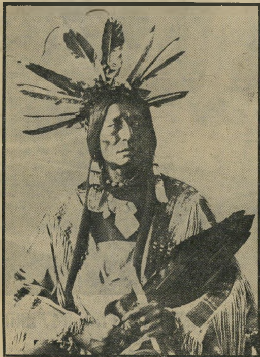
ראש-שבט אינדיאני * הגרשת וגם ירשת ?

איך החמצתי את ההצבעה הגדולה * הלך השמיר אצל העורב * היכן אליהו הנביא * הליכוד לא ישאיר אחריו אדמה חרוכה * מה טוב יותר - אולקוס או סרטן? * לולא פלאטו היה פלאטו