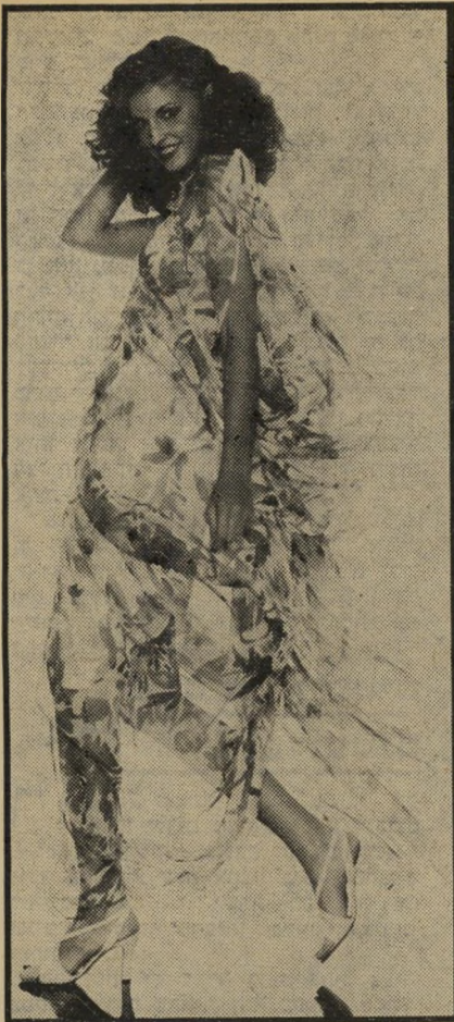
בית-האופנה ז'אן פאטו

בית-האופנה ג'יי לארוש פוצץ לי את הראש עם הופעה דרמטית של המראה הרספרדי. השסע מלפנים מאפשר לך לצאת