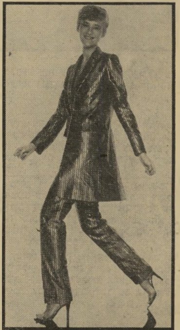
בית-האופנה טד לפידוס סיגנון הפראק

בריקוד פסדובלה ללא קושי, ועוד כמה דברים.