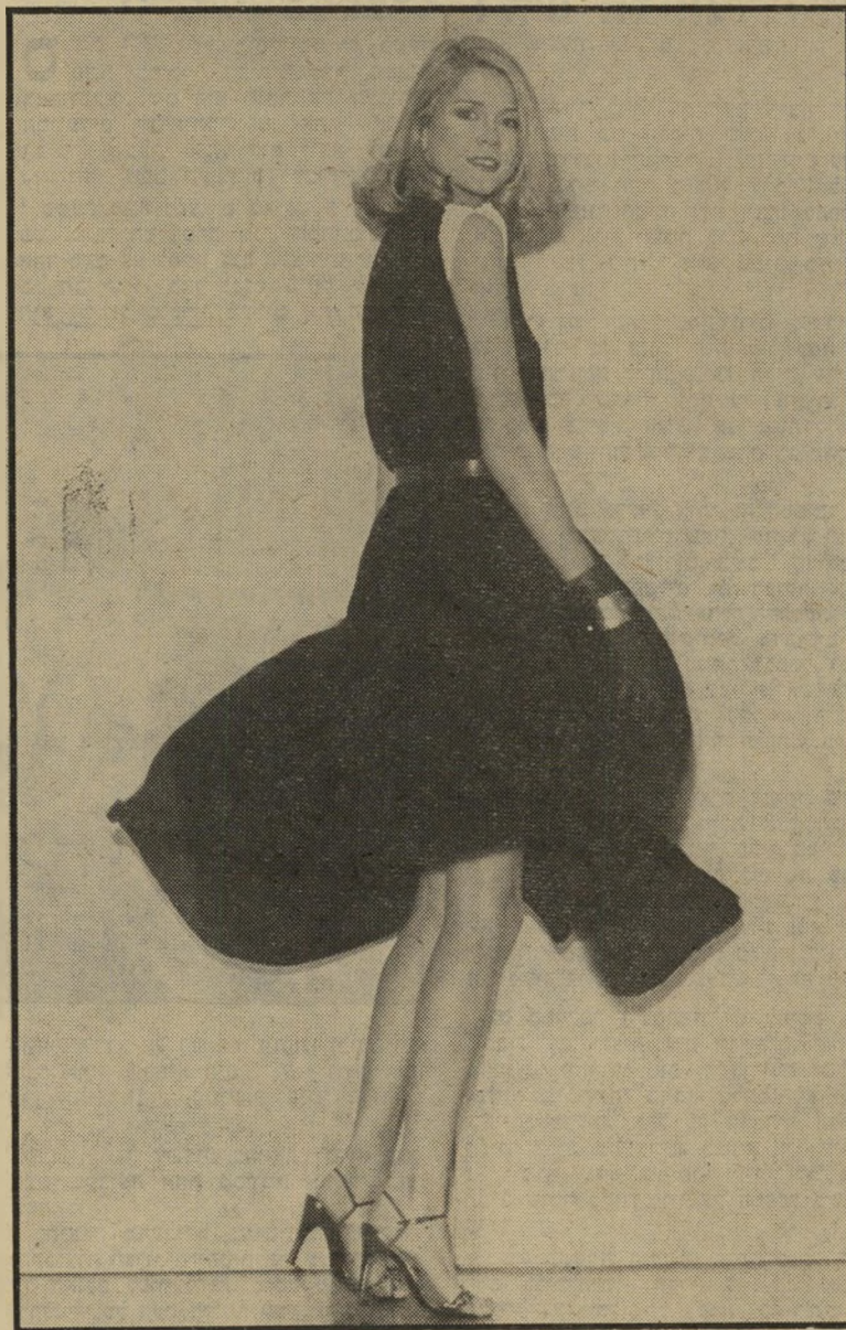
בית-האופנה שאנל השימלה השחורה הקטנה

נסיים את הסיור הצרפתי שלנו בביקור נוסף אצל טד לפידוס. זוהי חליפת מכ-נסיים בסיגנון גברי, מכנסיים צרות, כשמעל זה ז'קט ארוך מאד, המזכיר במיקצת את חליפת הפראק, הבד, כמוכן, מבריק ומתי-אים להופעה נוצצת.