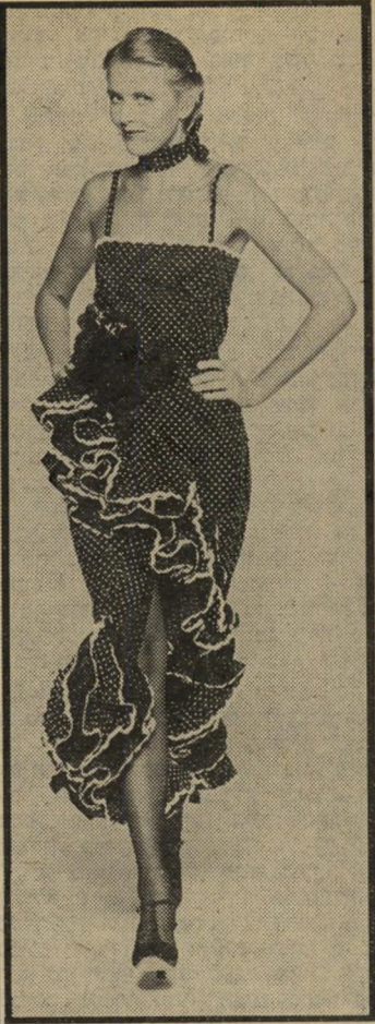
בית-האופנה ג'יי לארוש מיגוון סיגנונות צרפתיים לעונת המעבר