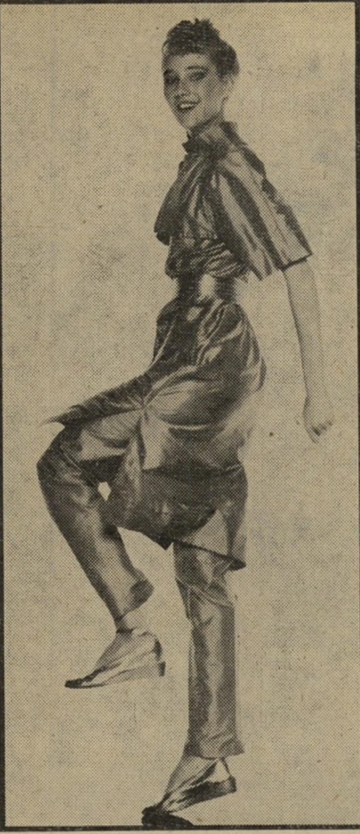
בית-האופנה טד לפידוס