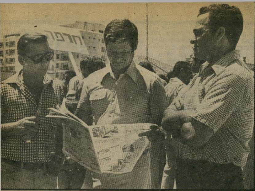
חיים יבין (במרכז) בהפגנה הגדולה, לידו יורם רינן (מימין) וטוביה סער. ללכת על חבל דק

הפגנה. לתומכי צוקרמן היה חשוב ביותר שיבין יתייצב בשורה הראשונה של המפגינים. במשך מרבית שעות ההפגנה, ובעיקר כאשר לפיד ואהרון פאפו יצאו אל המפגינים, הקפיד יבין לקרוא עיתון, כאילו העניין כולו אינו שייך לו.